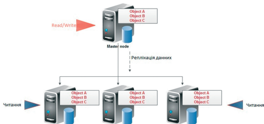
Рис. 2. Peer-to-peer реплікація

акцент на великий обсяг даних, а інші — на велику кількість зв'язків, в яких зберігається не тільки текстова інформація, а й зображення, тому важливо доробляти систему та оптимізувати її вже під конкретне завдання, оскільки створити систему та зробити її максимально простою та універсальною дуже складно. Розглядаючи готові рішення, слід зважувати на ціну, адже, навіть готові програмні продукти потрібно налаштовувати на виконання певних завдань, а в подальшому виділяти кошти та час на підтримку їх функціонування.