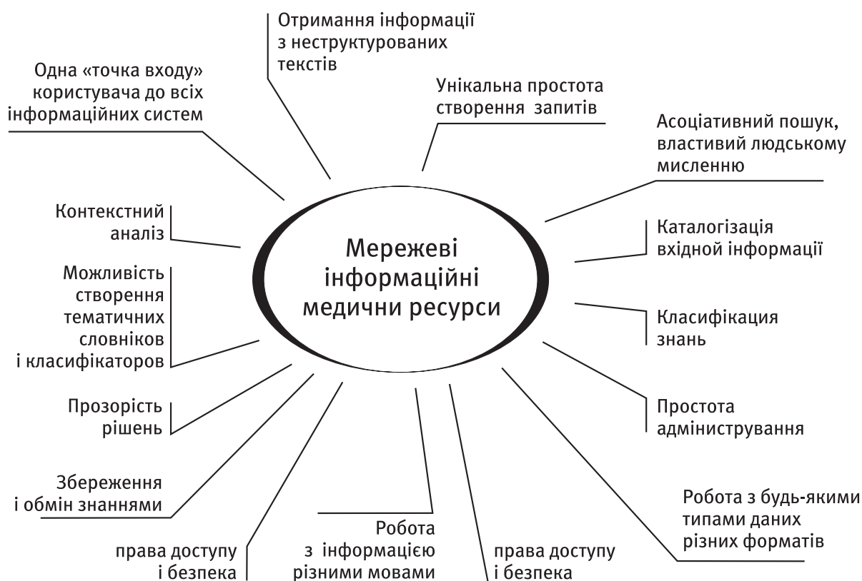
Рис. 1. Узагальнена схема визначення вимог щодо взаємодії лікарів та пацієнтів у сучасному інформаційному середовищі на основі використання змісту МД

Узагальнена схема визначення вимог щодо взаємодії лікарів та пацієнтів у сучасному інформаційному середовищі представлена на рис. 1.