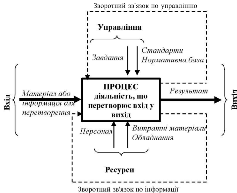
Рис. 1. Класична модель процесу.

Таким чином, вивчаючи діяльність лікаря для подальшої її формалізації, ми підходимо до проблеми опису основних компонентів цієї діяльності.